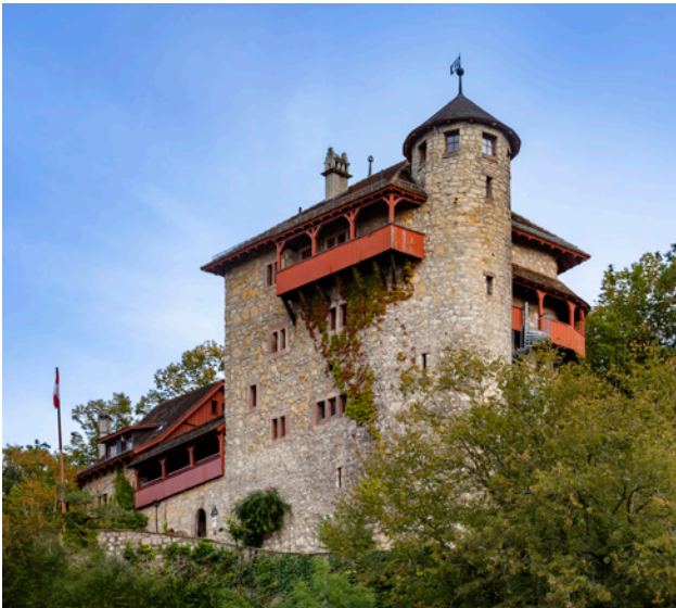
Jugendherberge Mariastein Burg Rotberg

Weitere kulturelle Anlässe sind auf den Gemeindefwebseiten und in den Dorfpublikationen zu finden.